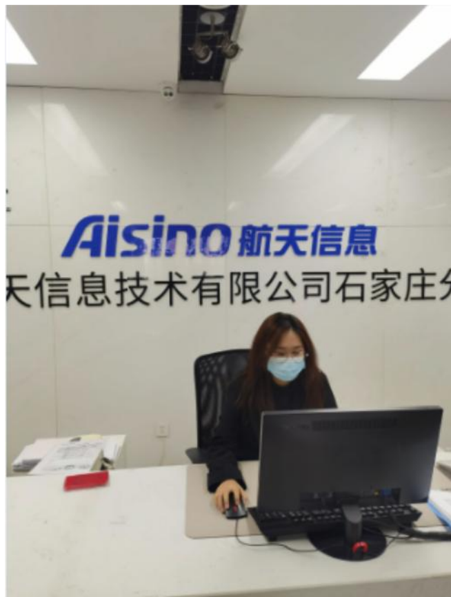
图五：学生岗位实习