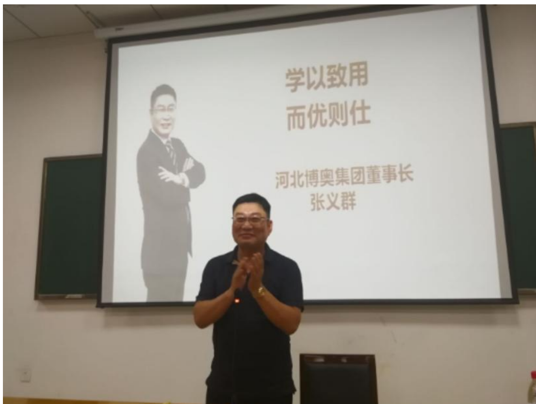
图六：校企合作企业专家授课