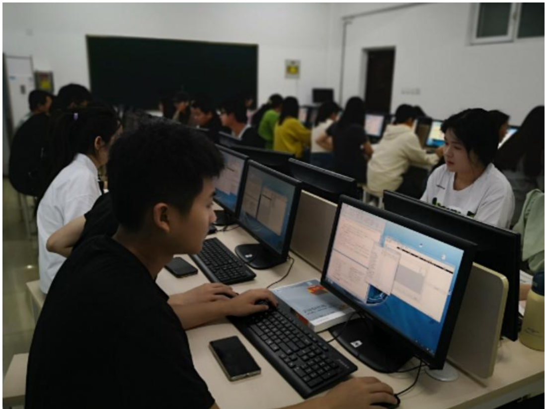
图二、图三：学生在校内会计专业实训室实训