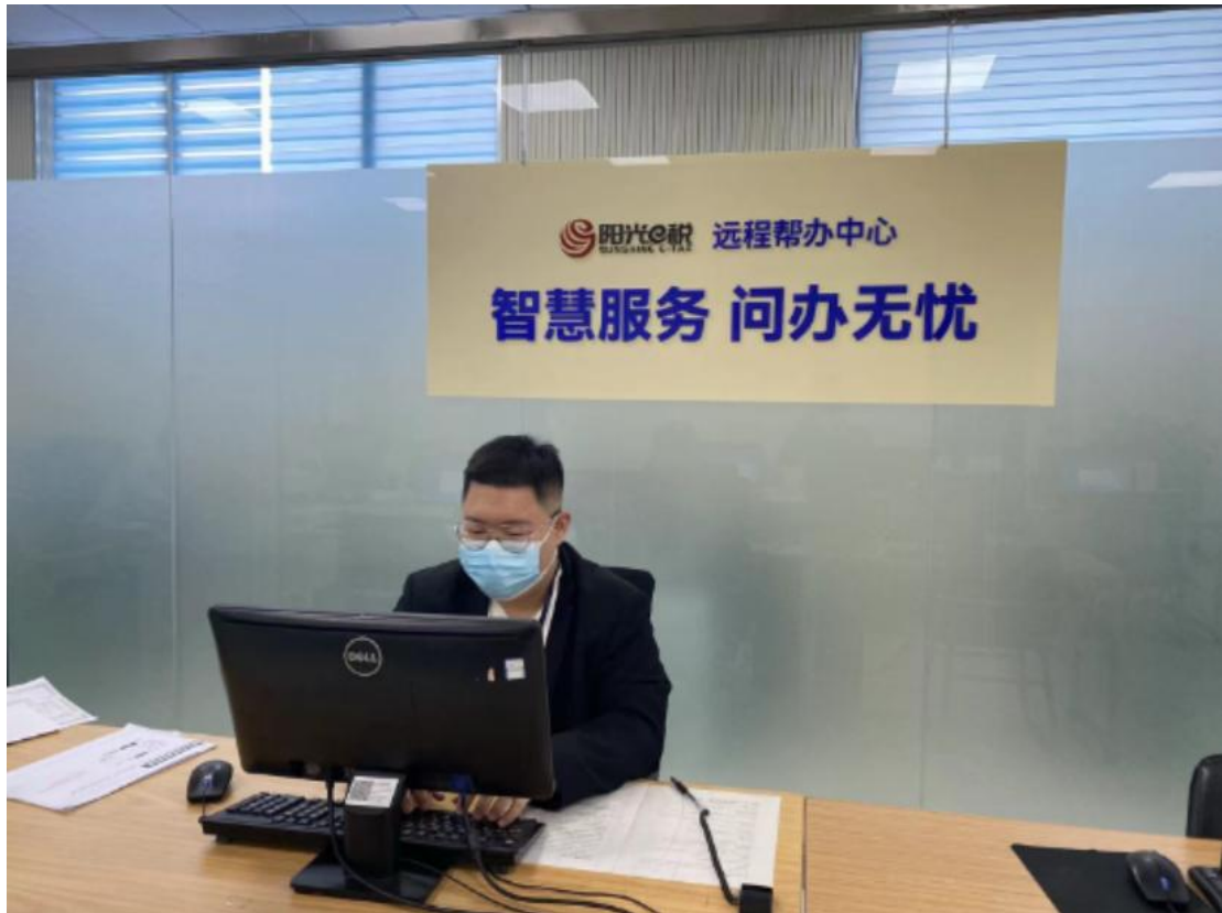
图四：学生岗位实习