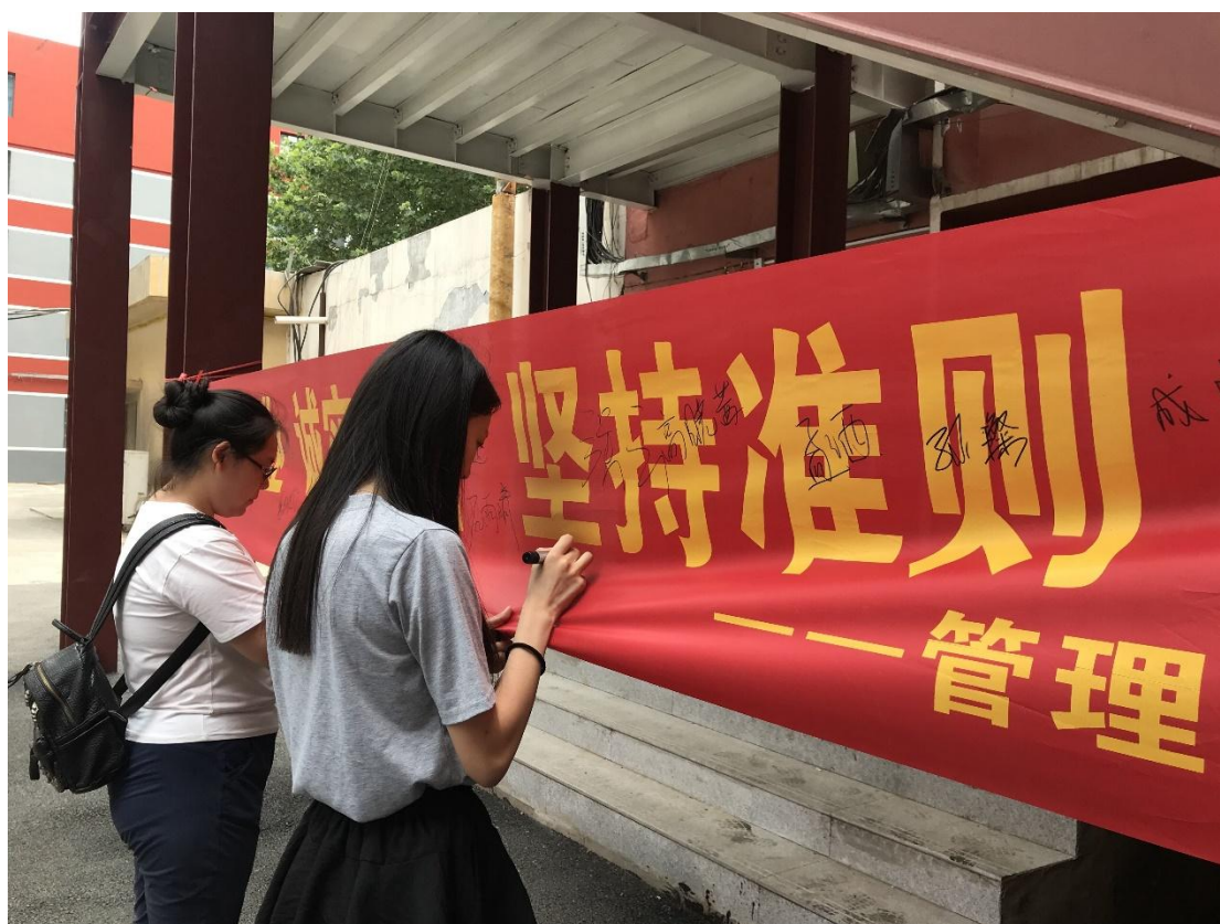
图七：学生校内“诚信”宣誓签字活动